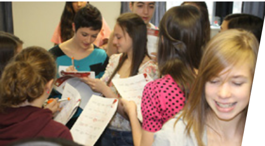
▲ Activité réseautage lors de la journée Glambition du 15 novembre.

Le Centre filles de la YWCA Québec offre une multitude d'activités gratuites aux filles de 9 à 17 ans de la région de Québec dans le but de favoriser le renforcement de leur pouvoir d'agir. Dans une perspective de prévention, l'ensemble des activités vise à outiller les filles en favorisant le développement de l'estime de soi, du leadership et l'adoption de saines habitudes de vie. Cette année, plus de 400 filles ont participé à une des activités proposées par le Centre filles et ses partenaires collaborateurs.