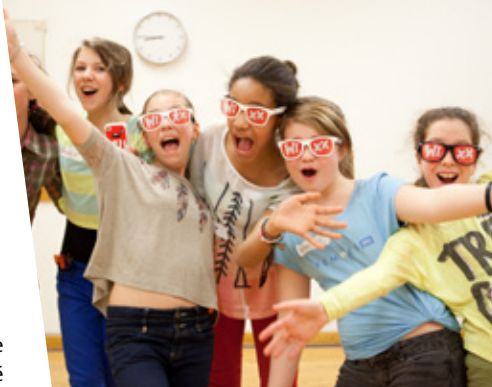
▲ Atelier de danse créative pendant l'activité Place aux filles.

Étape préalable au Gala Femmes de mérite, nous avons accueilli un nombre record de convives au Capitole de Québec pour le dévoilement des 33 finalistes 2013 parmi toutes les candidatures reçues au Concours. Pour en connaître davantage, lire la page 28.