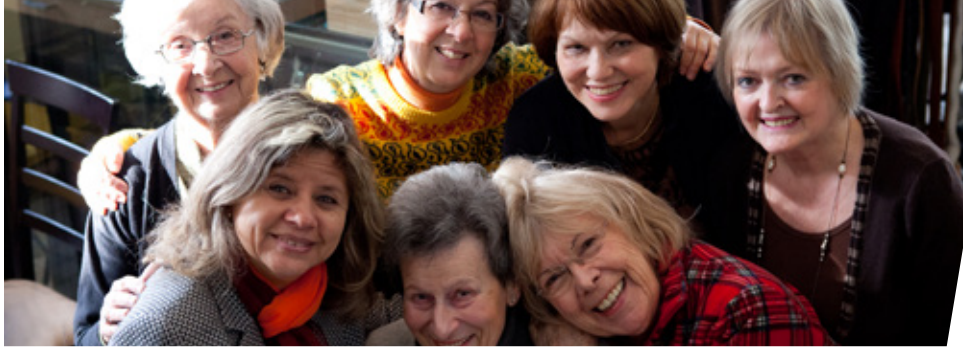
◀ Une partie de l'équipe de fidèles bénévoles du Chiffonnier d'Andrée, l'une des deux écoboutiques de la YWCA.