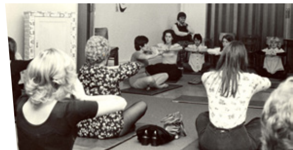
▲ La YWCA Québec au service des femmes depuis 138 ans.

Merci au Fonds communautaire Télus grâce auquel 10 000 $ nous a été remis pour assurer la continuité de notre Centre filles mobile. Se déplaçant gratuitement dans les écoles et organismes jeunesse, nos animatrices offrent des ateliers de discussions à des groupes de filles pour favoriser le développement de l'estime de soi, du leadership et l'adoption de saines habitudes de vie.