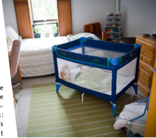
▲ Une chambre de La grande Marelle accueillant une femme et son enfant.