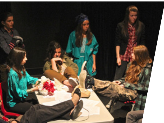
▲ Pièce de théâtre présentée par les participantes du programme Filles créatives.

boutiques, nous avons aussi agrandi la salle de tri des dons reçus qui ne cessent d'augmenter. Ces rénovations nous permettent d'offrir un meilleur environnement à nos bénévoles en plus de mettre davantage en valeur les articles vendus. En 2012-2013, les revenus de nos écoboutiques ont augmenté de 25 % ! Il s'agit d'une belle source d'autofinancement pour nous, et ce, depuis plus de 20 ans.