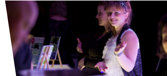
▲ Une résidente de La grande Marelle bénévole à la soirée.

Laurier Québec, fidèle partenaire de cette soirée, a offert une sortie magasinage d'une valeur de 1 000 $. Près de 100 personnes ont participé à ce tirage.