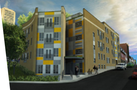
▲ Maquette représentant la nouvelle résidence Saint-Gabriel.

Nous offrons cinq chambres de type transitoire pour des femmes qui ont besoin de se déposer et qui ne sont pas prêtes à participer à un programme de réinsertion.