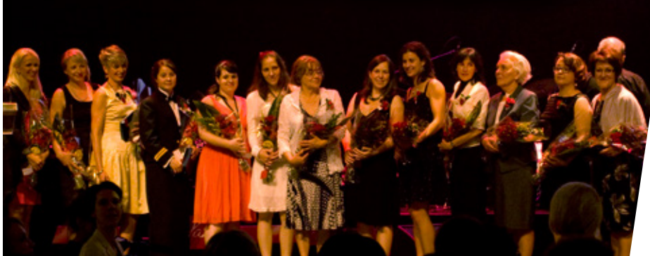
◀ Les lauréates du 15e Gala-bénéfice Femmes de mérite.