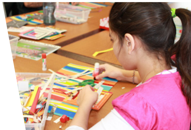
▲ Courtpointe réalisée lors de la Journée nationale d'action de la Fondation Filles d'actions.

De nombreuses familles se sont déplacées au parc Saint-Sacrement pour profiter des glissades, jeux gonflables, cabane à sucre et bien d'autres activités. La YWCA Québec, fidèle au poste, était responsable de l'animation de la scène. Des présentations de cours ont fait bouger petits et grands. Les résidentes de La grande Marelle ont participé à la fête en offrant du temps de bénévolat et en vendant des barres tendres ainsi que des boissons chaudes, dont de la tisane de notre Jardin pour Soi.